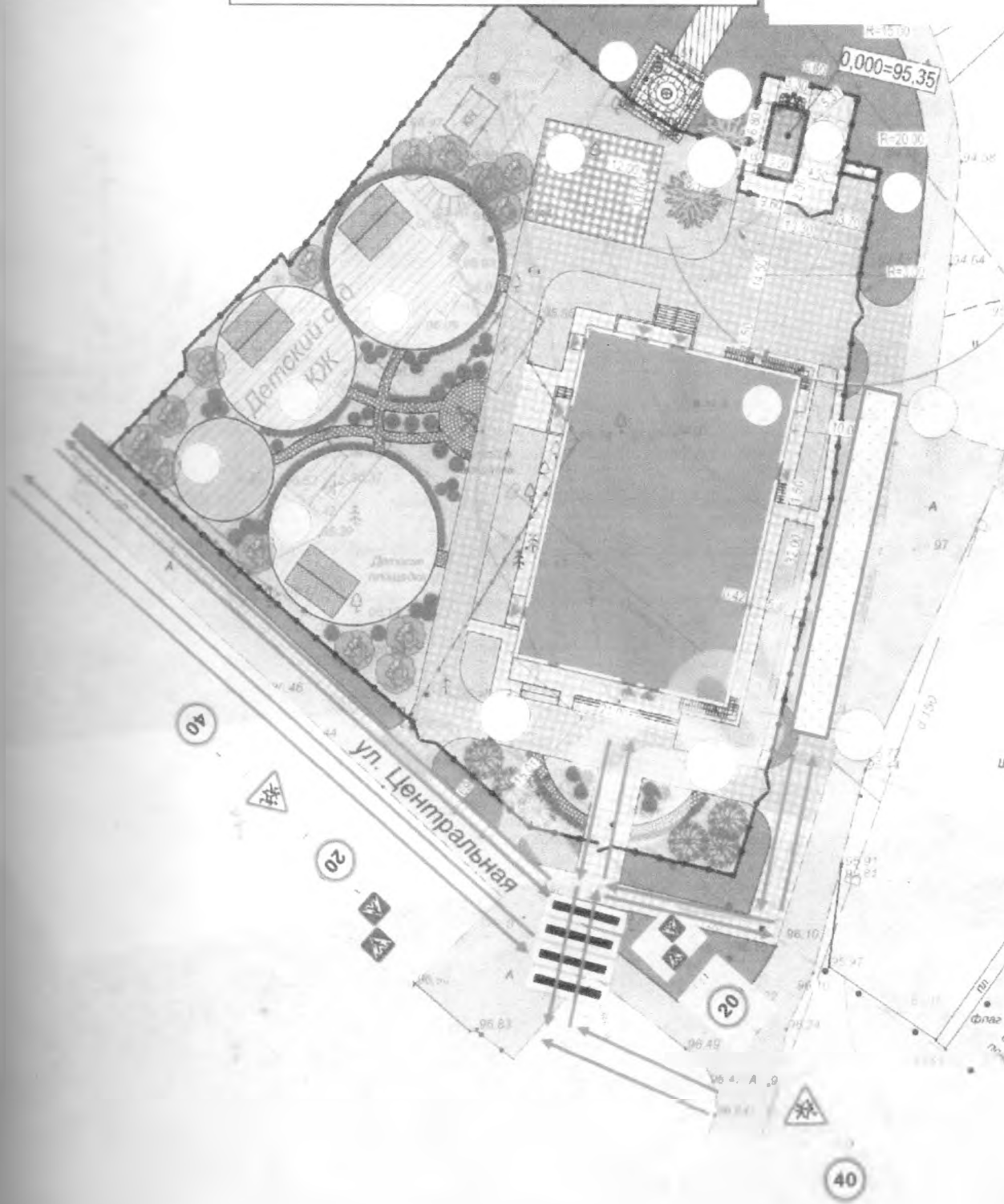
Схема организации дорожного движения в непосредственной близости от Ютановского детского сада с размещением соответствующих технических средств, маршруты движения детей и расположение парковочных мест